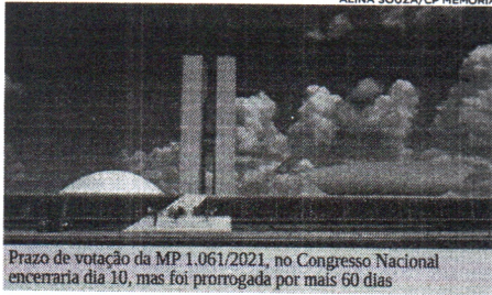
Prazo de votação da MP 1.061/2021, no Congresso Nacional encerraria dia 10, mas foi prorrogada por mais 60 dias

A Medida Provisória (MP) 1.061/2021, que cria o novo programa de transferência de renda do governo federal, o Auxílio Brasil, em substituição ao Bolsa Família, cujo prazo de análise e votação no Congresso Nacional se encerra no dia 10 de outubro, teve sua vigência prorrogada por mais 60 dias. A decisão foi publicada na edição dessa segunda-feira (4), do Diário Oficial da União (DOU). Outras quatro MPs enviadas pelo Poder Executivo ao Parlamento, cujos prazos de análise também estão vencendo nos próximos dias, também tiveram seus prazos prorrogados pelo presidente do Congresso, Rodrigo Pacheco (DEM-MG) e publicada. São elas: a MP 1.060/2021, que repassa R$ 3,5 bilhões para acesso à internet na rede pública de educação; MP 1.062/21, que cria o Programa Alimenta Brasil para substituir o atual Programa de Aquisição de Alimentos (PAA); a MP 1.062/2021, que libera R$ 9,1 bilhões para ações de combate à pandemia; e a MP 1.063/2021,