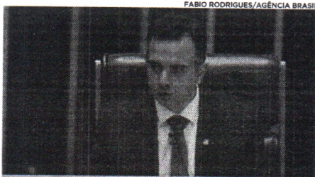
Rodrigo Pacheco, presidente do Senado, prorrogou por 60 dias o prazo de vigência de outras três Medidas Provisórias

A Lei 14.172 foi sancionada em 11 de junho, após o Congresso Nacional derrubar o veto integral de Jair Bolsonaro ao texto que garantia internet para as escolas públicas. O presidente da República alegou que a matéria não apresentava estimativa do respectivo impacto orçamentário e financeiro. Ele também argumentou que a medida aumentaria a "rigidez do Orçamento", o que dificultaria o cumprimento da meta fiscal e da regra de ouro, estabelecida pela Constituição Federal. A MP também concede ao Poder Executivo a responsabilidade de disciplinar as regras para o repasse dos recursos, até mesmo quanto aos prazos, à forma de repasse dos valores e à prestação de contas de sua aplicação. O